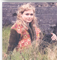
Folklore Jacke aus der aktuellen Verena