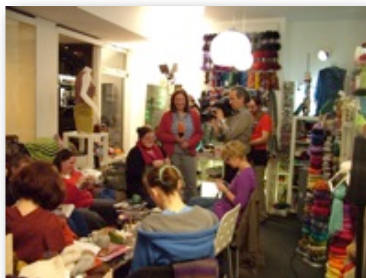
Dreharbeiten, November 2009

http://www.zdf.de/ZDFmediathek/beitrag/video/927012/drehscheibe-am-16.-Dezember-2009#/beitrag/video/914960/drehscheibe-am-2-Dezember-2009/ (ca 40:30 Minute...)