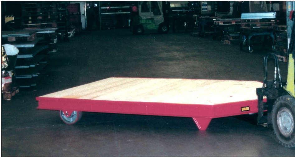
Mit den Gabelzinken in die Einfahrtaschen fahren, anheben und das STS ist betriebsbereit

Optimiert die Transportlogistik mit dem Stapler. Wege werden verkürzt und die Nutzlast erhöht