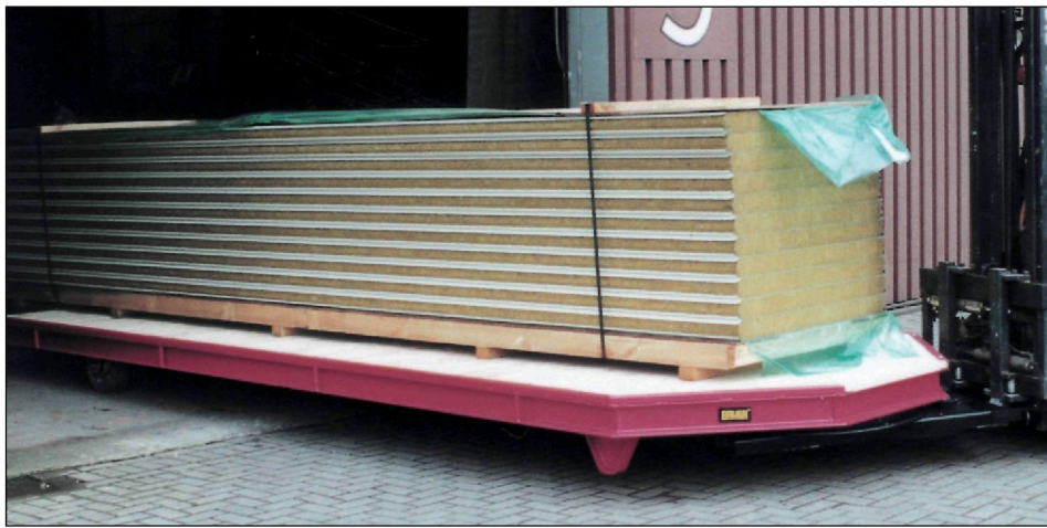
Transport von Langgütern; kleiner Wendekreis durch Direktaufnahme