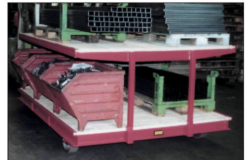
Zusätzliche Ladefläche durch steckbaren Aufsatz