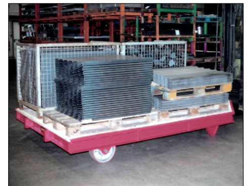
Kommissionierung von Fertigungsteilen