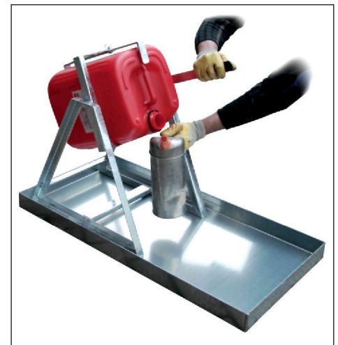
Typ KGW 2 mit Kanister-Abfüllhilfe Typ KAH-25 siehe Seite 83