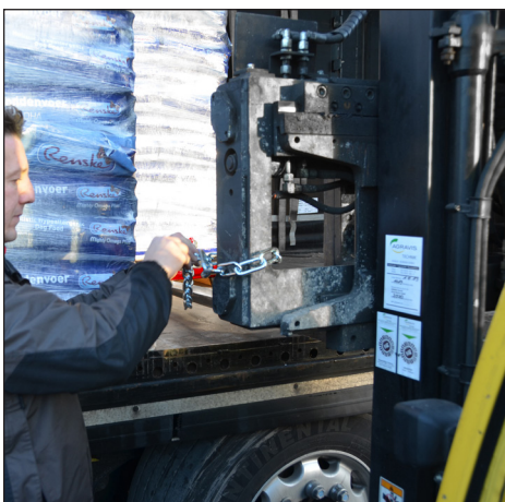
Befestigen bzw. Entfernen der Zugkette