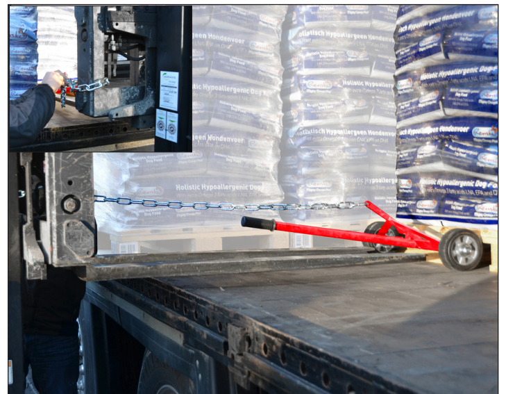
Heranziehen der Palette mittels Gabelstapler in die „Erste Reihe“