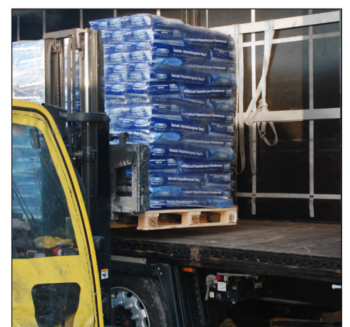
Aufnahme der Palette