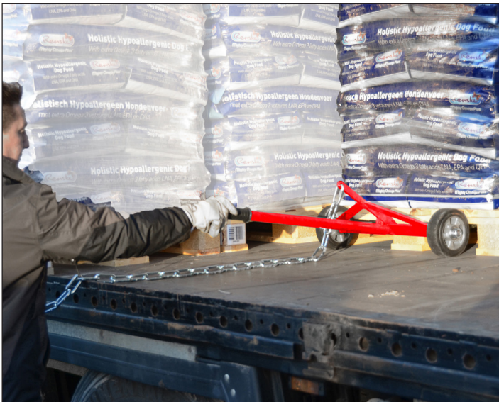
Einsetzen in die Palette