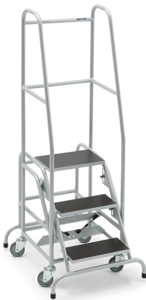
Stufen und Plattform mit Siebdruckplatte