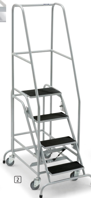
Stufen und Plattform mit Riefengummi