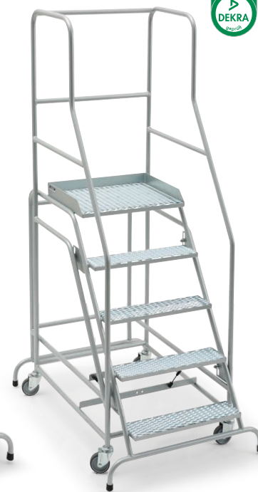
Stufen und Plattform aus Rautengitter