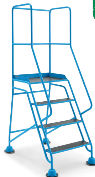
Stufen und Plattform mit Siebdruckplatte