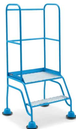
Stufen und Plattform aus Rautengitter