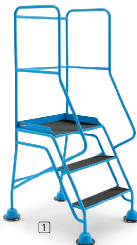
Stufen und Plattform mit Riefengummi