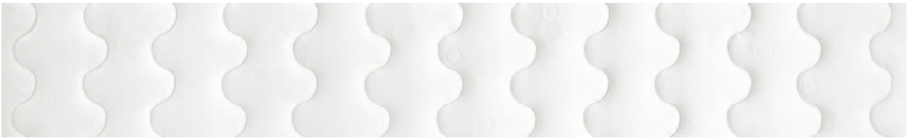
Unzonierte Versteppung für unzonierte Kernseite