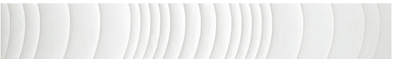
Zonierte Versteppung für zonierte Kernseite