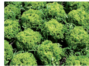
Anwendung mit Palaterra®