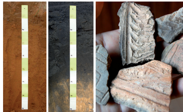
Links: Ursprünglicher, unfruchtbarer Oxisol-Boden am Amazonas Mitte: Die Terra Preta-Bodenschichten weisen Stärken bis 2 m auf Rechts: Verzierte Tonscherben aus den Fundorten der Terra Preta

Palaterra® engagiert sich in zahlreichen nationalen und internationalen Forschungsprojekten und eigenen Versuchsreihen zur stetigen Weiterentwicklung dieser zukunftsweisenden Neuen Terra Preta.