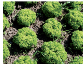
Anwendung ohne Palaterra®

Wiederbelebung. Bei mittleren und schweren Böden trägt Palaterra® Beet & Garten zu einer Lockerung und guten Durchlüftung bei. Schaderreger und bodenbürtige Krankheiten werden wirksam unterbunden.