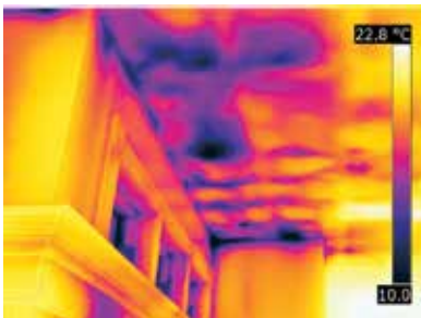
Schnelle Erkennung von Feuchtigkeit und Gebäudemängeln