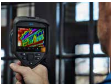
Einhändige Bedienung über komfortable Tasten zur sicheren, bequemen Nutzung