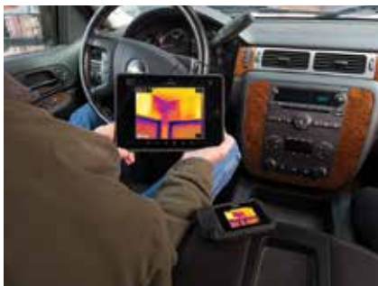
Bilder über WLAN in FLIR Tools laden