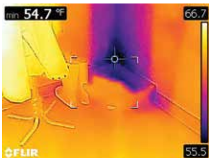
Bereichsfeld mit Cold-Spot-Anzeige macht einströmende Luft sichtbar