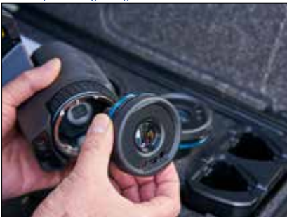
Die intelligenten AutoCal™-Wechselobjektive (Weitwinkel bis Telezoom) lassen sich auch an Ihren anderen Kameras nutzen