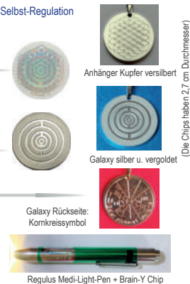
Anhänger Kupfer versilbert