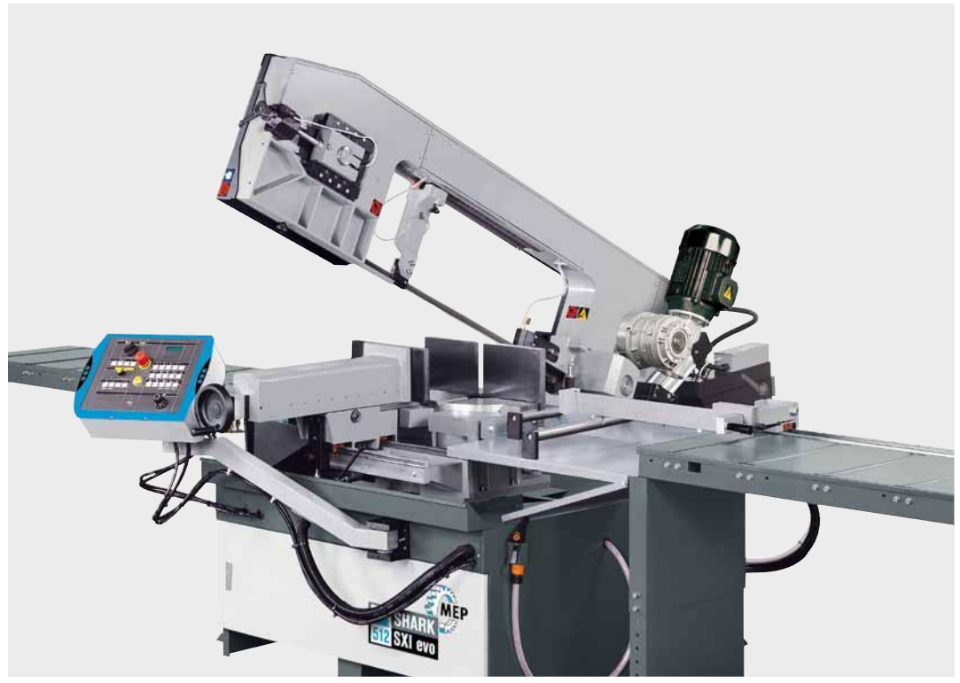
ZUBEHÖRE - SEITE 23 - N° 01 - 02 - 03 - 07 - 11 - 12 - 31

SHARK 512 SXI evo, halbautomatische elektrohydraulische Bandsägemaschine für Schnitte von 60° links bis 60° rechts. - Vielseitig anwendbare Maschine mit einem Band von 4640x34x1,1 mm für das Zuschneiden von Rohren, Profilen und Trägern bis zu einem max. Schneidbereich von 510x320 mm auf 0°. SCHNITZIKLUS: - Halbautomatischer Betrieb: Der Bediener positioniert manuell das Werkstück und startet die Maschine. Bei Zyklusbeginn erfolgt: - Schraubstock schließt sich und Motor läuft an - Sägekopf senkt sich für den Schnitt - Motor schaltet ab - Sägekopf hebt sich - Schraubstock öffnet sich. - ZYKLUS DOWN-UP Im halbautomatischen Zyklus ermöglicht die Taste DOWN den Sägekopf und die Rotation des Sägebandes bei Schnittende zu stoppen indem der Schraubstock geschlossen bleibt. Damit der Sägekopf wieder hochfährt und der Schraubstock öffnet muss die Taste UP auf dem Bedienfeld gedrückt werden.