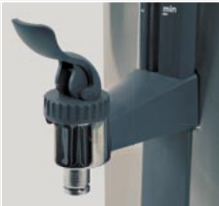
Schnell und einfach: zapfen mit dem handlichen No-Drip Hahn.

Bravor Bonamat bietet eine große Vielfalt an qualitativ hochwertigen Heißwasser- und Milchgeräten an. Die Heißwasserserie erhitzt große Mengen Wasser auf die gewünschte Temperatur, perfekt um eine Tasse Tee, eine Suppe oder andere Heißgetränke zuzubereiten. Die HM-Serie wurde zum Erwärmen von Milch entwickelt und umfasst auch die HCM-Serie, ein Gerät welches speziell für die Zubereitung von Trinkschokolade geeignet ist. Beide Serien erwärmen das Getränk schonend mittels eines Wasserbades und verhindern somit ein Anbrennen des Getränks. Die Behälter lassen sich problemlos überall platzieren und die Getränke lassen sich somit dort beziehen, wo sie benötigt werden.