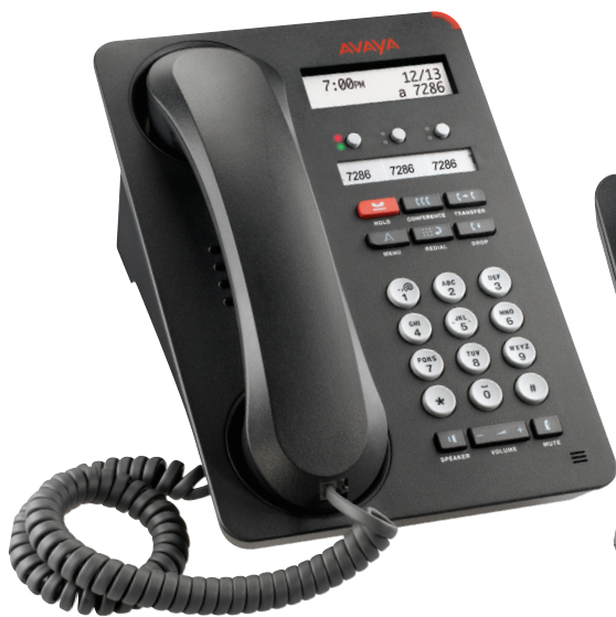
IP-Tischtelefon 1603-I IP-Tischtelefon 1603SW-I