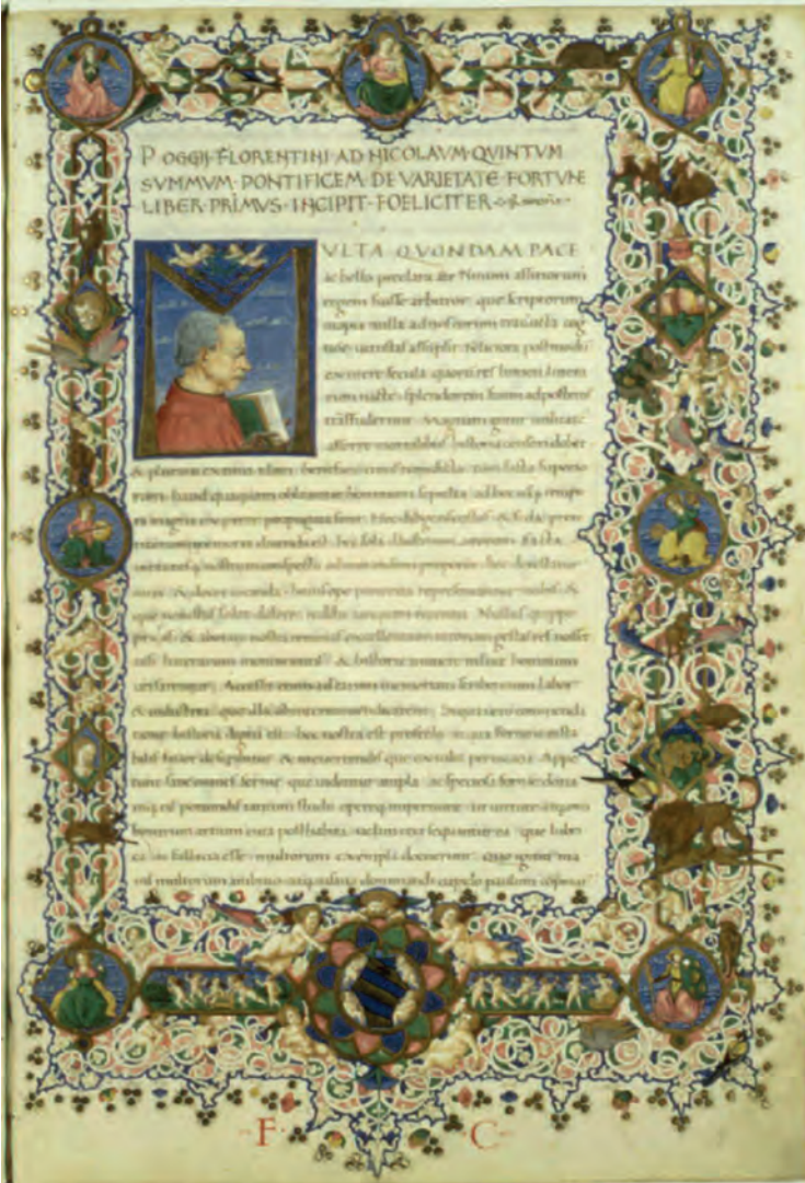
Image 3: De varietate fortunae , Vatican Library, Ms. Urb. lat. 224 (15 th century). 31

Poggio's way of fashioning letters was a move away from the intricately interwoven and angular writing known as Gothic hand. The demand for more open, legible handwriting had already been voiced earlier in the century by Petrarch (1304–1374). Petrarch complained that the writing then in use in most manuscripts often made it extremely difficult to decipher the text, "as though it had been designed," he noted, "for something other than reading." To make texts more legible, the individual letters had somehow to be freed from their interlocking patterns, the spaces between the words opened up, the lines spaced further apart, the abbreviations filled out. It was like opening a window and letting air into a tightly closed room.