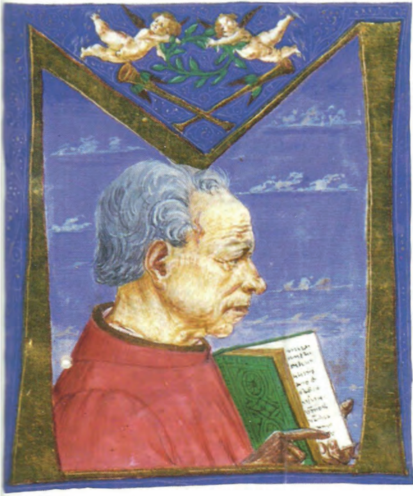
Image 1: Portrait of Poggio Bracciolini from an illuminated manuscript ( De Varietate Fortunae ) in the Vatican Library, Urb. lat. 224, 15 th century. 18

As has been mentioned above, the fascinating quality of Greenblatt's essay to a great deal resides in the author's talent of storytelling. The chapters retrace Poggio's successful career as a professional scribe and humanist scholar as well as his journey to Germany in the retinue of the Pope John the twenty-third leading ultimately to the climax of the discovery of long lost manuscripts. The story is thus carefully constructed, brilliantly written and reads like a detective story.