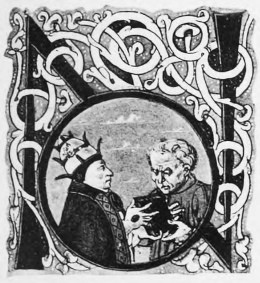
Image 2: Miniature from an illuminated manuscript showing Greenblatt's protagonist Poggio giving a manuscript to the Pope (Pope Niccolò V. receives a book from Poggio Bracciolini) 15 th century. 19

Obviously, Greenblatt also reconstructs and expounds a great deal of cultural history. On the scholarly level, however, the historical events and contexts seem far less relevant than on the level of plot structure, since the argument is, as we shall see, mainly based on textual components and on the material constituents of the writing process itself. This is all the more surprising if we take into consideration that Greenblatt in his early essays had launched a polemical attack on the technique of close reading and the philological reverence towards the text in