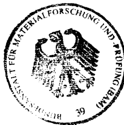
Dipl.- Ing. B.-U. Wienecke

Arbeitsgruppe Zulassung und Verwendung Im Auftrag / For