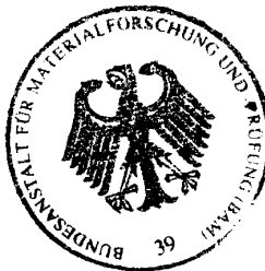
Dipl.- Ing. B.-U. Wienecke

Arbeitsgruppe Zulassung und Verwendung Im Auftrag / For