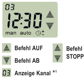
(Abb. 2) LCD-Display: