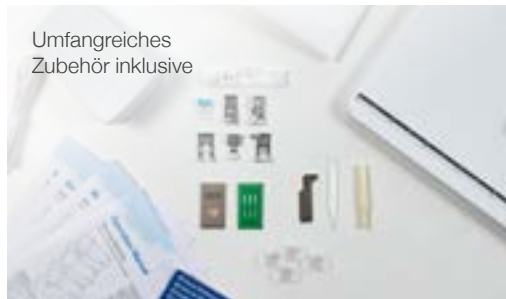
Umfangreiches Zubehör inklusive

inkl. Anschlagetisch 42 x 24 cm Arbeitsfläche