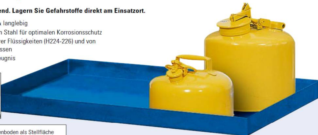
Feuerverzinktes Lochblech oder Wannenboden als Stellfläche