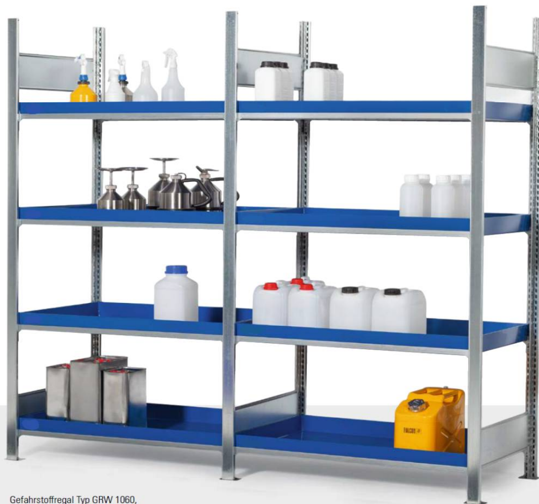
Gefahrstoffregal Typ GRW 1060, bestehend aus Grund- und Anbaufeld