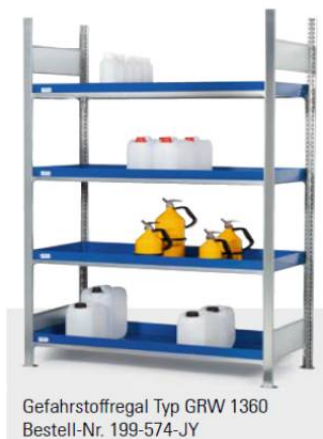
Gefahrstoffregal Typ GRW 1360 Bestell-Nr. 199-574-JY

Alle Regale verzinkt für optimalen Korrosionsschutz