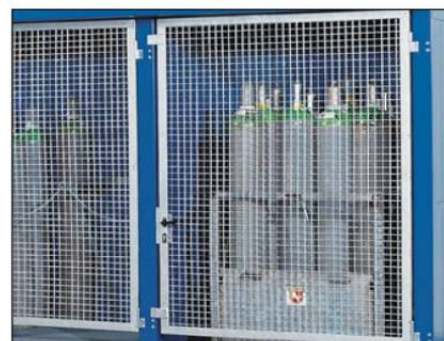
Die Türen, wahlweise als Gitter- oder brandgeschützte Version, sind abschließbar und schützen so vor dem Zugriff durch unbefugte Personen.