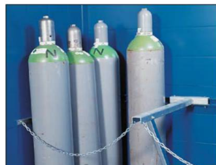
Serienmäßig mit Sicherungsketten zur sicheren Lagerung von Einzelflaschen.