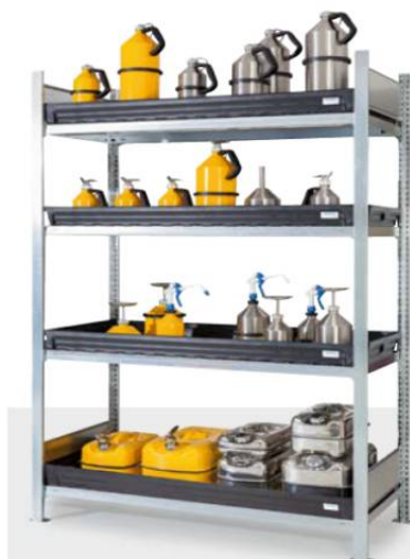
Gefahrstoffregal Typ GWK 1360 Bestell-Nr. 273-927-JY