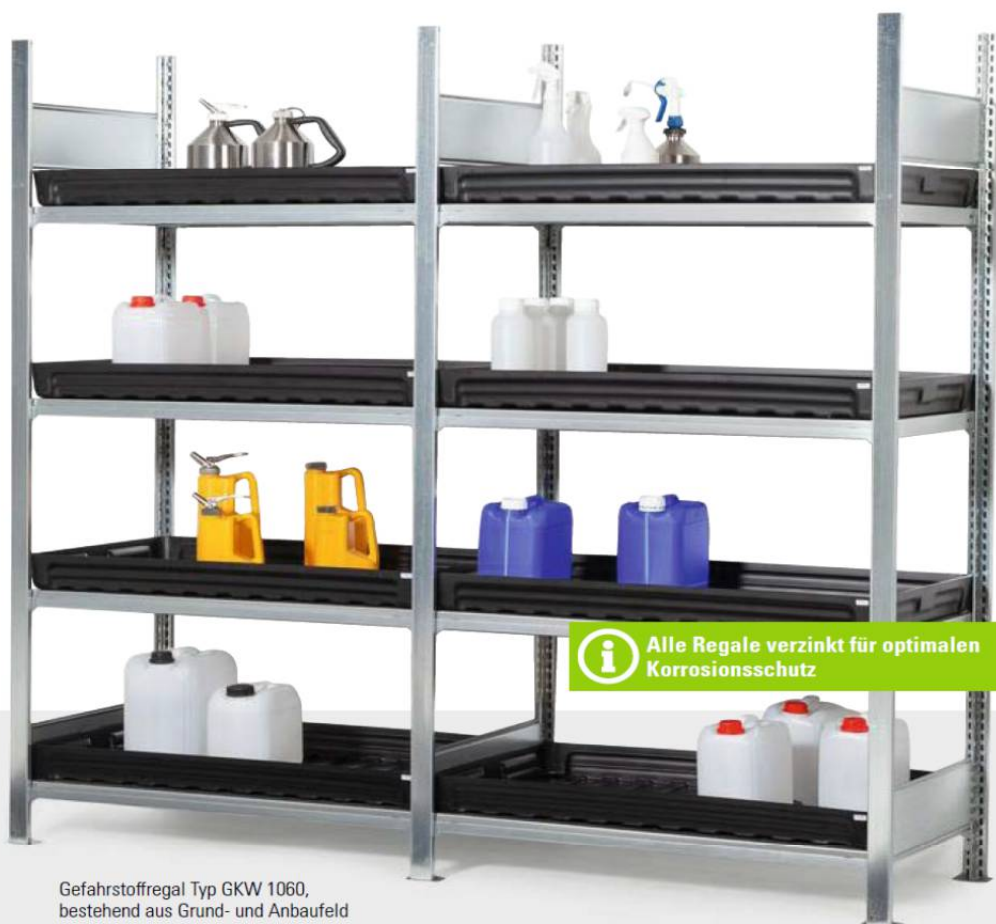
Gefahrstoffregal Typ GWK 1060, bestehend aus Grund- und Anbaufeld