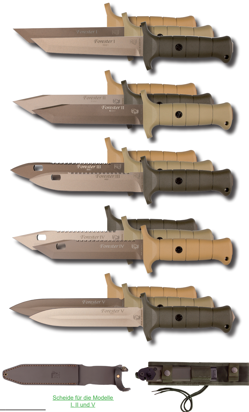
Scheide für die Modelle I, II und V

See price list or www.eickhorn-solingen.com for all versions/variations and respective part numbers.