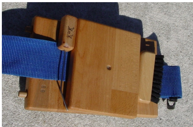
Abbildung 3 (Zubehör beim Transport verstaute)

Sowohl die Reinigungsnadel als auch die Bürste lassen sich beim Arbeiten am Board und beim Transport an der Halterung einfach befestigen.