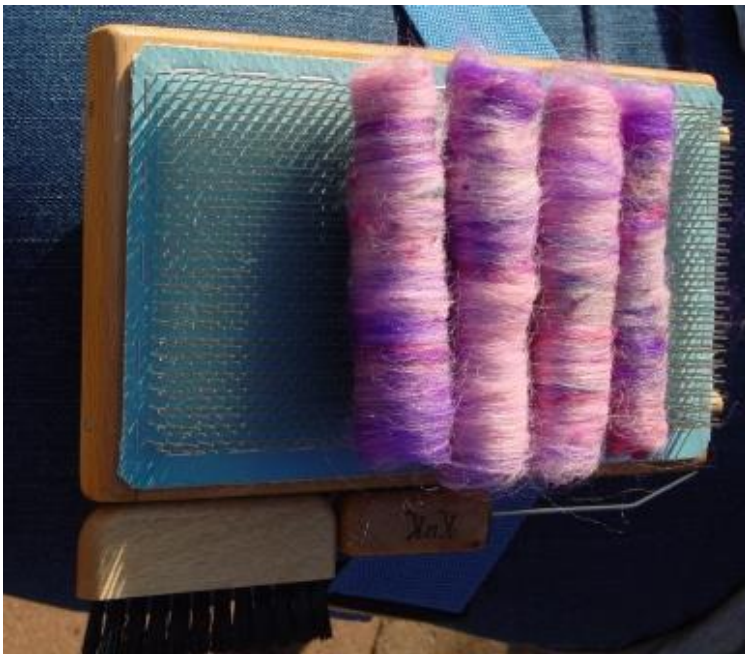
Abbildung 8 (fertige Rolags)

Mit einem bisschen Übung hat man dann anschließend die fertigen Rolags produziert.