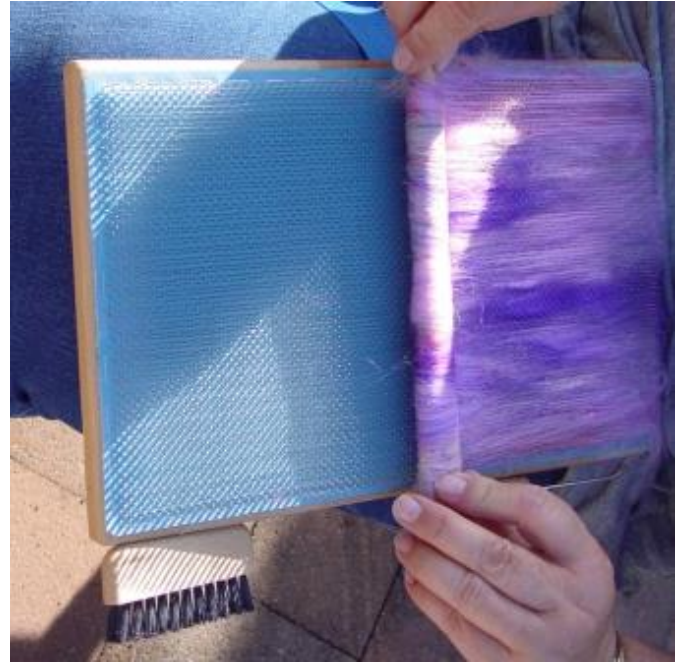
Abbildung 7 (Rolags abnehmen)

Anschließend dreht man das Blending Board um 90° (je nach Vorliebe gegen oder im Uhrzeigersinn) und kann die Rolags mit Hilfe der beiden Stäbe abnehmen.