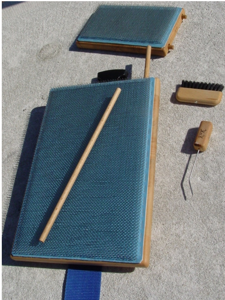
Abbildung 1 (Oben das Mini und unten das Maxi)

Mit einem Blending Board lassen sich Rolags und Batts aus den verschiedensten Fasern herstellen.