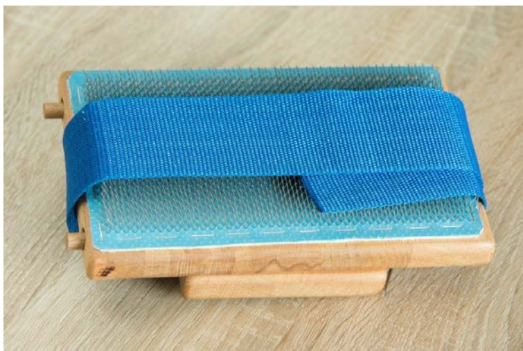
Abbildung 5 (Blending Board transportfertig)

Auch die Bürste und die Reinigungsnadel können einfach am Board mit Hilfe von Magneten angeheftet werden und sind somit immer griffbereit.