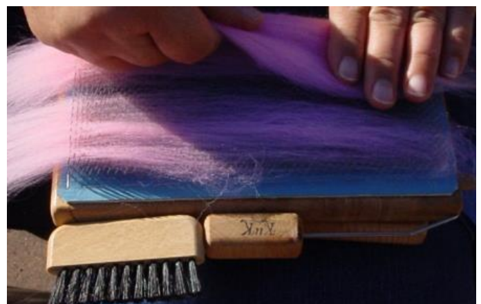
Abbildung 6 (Oben ist hier auf dem Bild rechts)