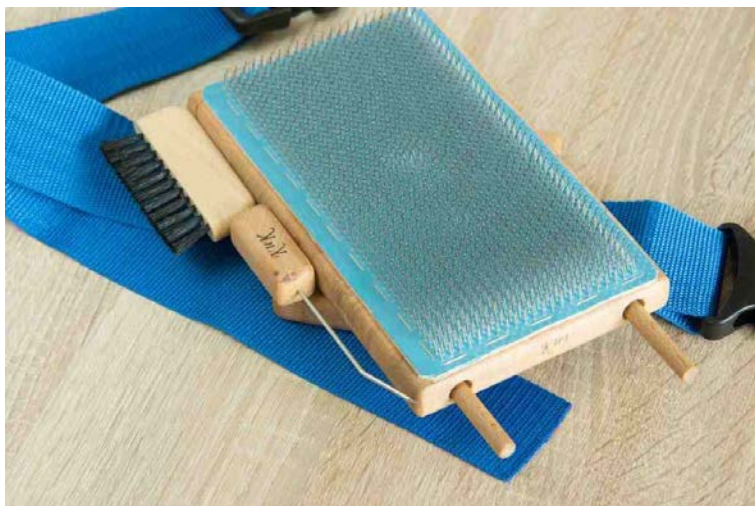
Abbildung 4 (Blending Board mit Zubehör)

Die Abnehmstäbe haben unterschiedliche Längen, damit man sie einfacher aus den fertigen Rolags ziehen kann. Bei Nichtgebrauch können diese im Brett verstaut werden. Durch die eingebauten Magnete fallen diese auch nicht heraus.