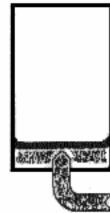
2. Ballastwasser pumpen