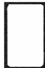
5. völlig beschichtete Oberfläche