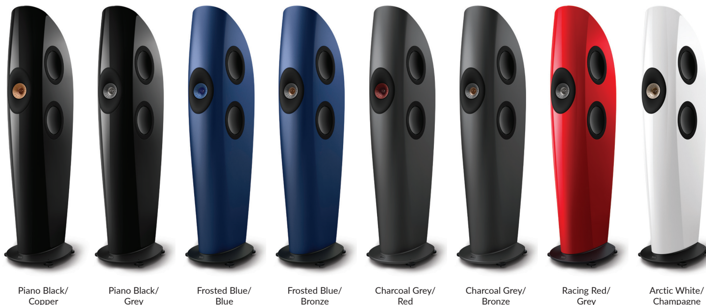
Piano Black/ Copper

Mit der Philosophie der Innovation im Streben nach dem genauesten und realistischsten Klang geht es bei Blade um die Perfektionierung eines bahnbrechenden Konzepts, und die Begeisterung der Zuhörer durch ein ultimatives Hörerlebnis.