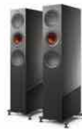
Titanium Gloss Special Edition (Exklusiv für R7 Meta)